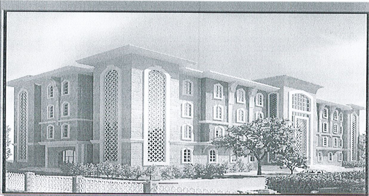
SIIRT İL ÖZEL İDARE BİNASI METROPLAN