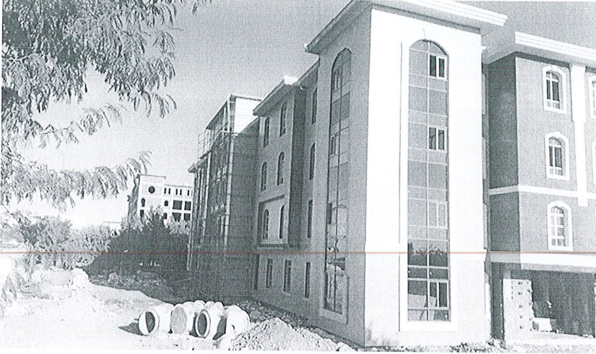
Yeni Hizmet Binası Son Hali