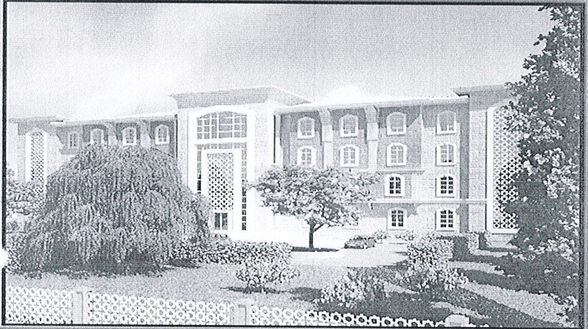
SIIRT İL ÖZEL İDARE BİNASI METROPLAN

Son Durum: İş başladığından itibaren işin 90'nı bitmiş olup çalışmalar devam etmektedir.